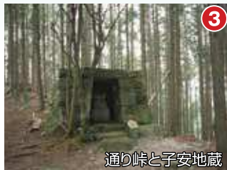
通り峠と子安地藏

山腹に築かれた約7.2haの見事な棚田と山並みが一望できます。慶長6年(1601)には2,240枚の水田があったと記録されています。