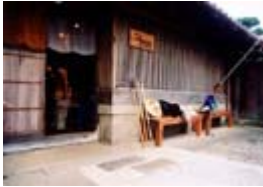
「紀南ツアーデザインセンター」

8:00 0km 尾鷲市賀田町出発 甫母峠(曾根次郎坂・太郎坂) 10:30 5km 熊野市二木島町(トイレ休憩) 二木島峠・逢神坂峠 13:00 10km 熊野市新鹿町(海水浴場:昼食) 13km 波田須・大吹峠入り口(トイレ休憩) 15:30 15km 熊野市大泊町 16:00 16km 松本峠・鬼ヶ城東屋 16:30 17km 紀南ツアーデザインセンター(休憩) 17:00 18km 熊野市有馬町到着 歩行時間約8時間 伊勢から153km